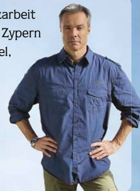
Hannes Jaenicke Schauspieler und Umweltschützer

„Ich unterstütze die Vogelschutzarbeit der Stiftung Pro Artenvielfalt auf Zypern zur Rettung heimischer Zugvögel, die dort illegal gefangen und qualvoll getötet werden. Bitte helfen auch Sie!“