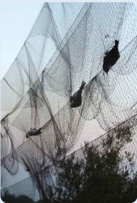
Fangnetz mit Vogelopfer