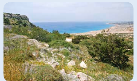
Südostküste Zypern

Während des Frühjahrs-Vogelschutzcamps an der Südwestküste Zyperns kontrollierten und dokumentierten die ehrenamtlichen Vogelschützer des Komitee gegen den Vogelmord und unserer Stiftung 292 uns aus den Vorjahren bekannte Fangplätze.