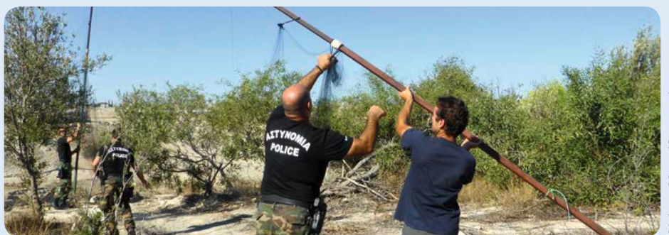
Abbau Vogelfanganlage

Pro Leimrute werden im Frühjahr bis zu 15 Zugvögel gefangen, mit einem Fangnetz bis zu 600. Umso erfreulicher ist die rückläufige Anzahl aufgefundener Fanggeräte: