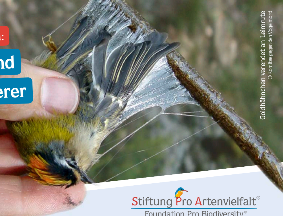
Goldhähnchen verendet an Leimrute

Stiftung Pro Artenvielfalt® Foundation Pro Biodiversity®