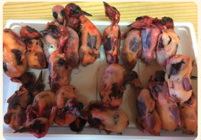
Mönchsgrasmücken für zypriotische Delikatessen „Ambeloupolia“

Wir brauchen Ihre Unterstützung im Kampf gegen den Vogelmord. Danke für Ihre wichtige Spende!